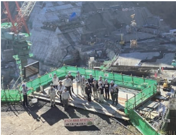
写真-1 現場見学風景