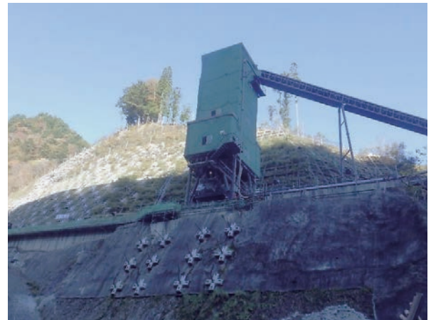
写真-3 バッチャープラントとトランスファーカー