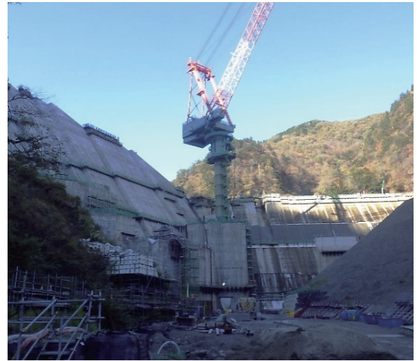
写真-2 ダムサイトの巨大タワークレーン

運搬設備の稼働時は警報のようなアラーム音ではなく、わりと耳なじみの良い音楽が流れており、工事現場特有の作業音もさほど気になりませんでした。大型機械の傍で長期間作業をすると負荷になるような機械音も少なく、耳鳴りの軽減など、現場環境の向上にも効果があるように感じました。