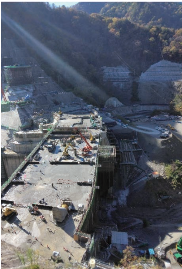
写真-2 内ヶ谷ダム 左岸天端展望台からの眺め

かったり、左岸側の法面に変状が出たりとその都度対策に追われご苦労されたようです。やはりこのような大規模な事業になると予定通りにはいかないことも多々あるんだなと実感しました。実際、右岸側の割れ目周辺には劣化した岩盤が広がっていることが分かり、その部分をコンクリートで置換する工事を行い、左岸法面変状対策としては、排土工、アンカー工、排水トンネル工を実施したということをお教えいただきました。私はダム建設に関わる施工方法や、タワークレーンやバックホウ等の工事車両は言葉としては知っていたものの実際に見ることができて非常に良い経験となりました。今後、このような大規模事業に携われるよう私自身、技術力向上に努めたいと改めて思いました。