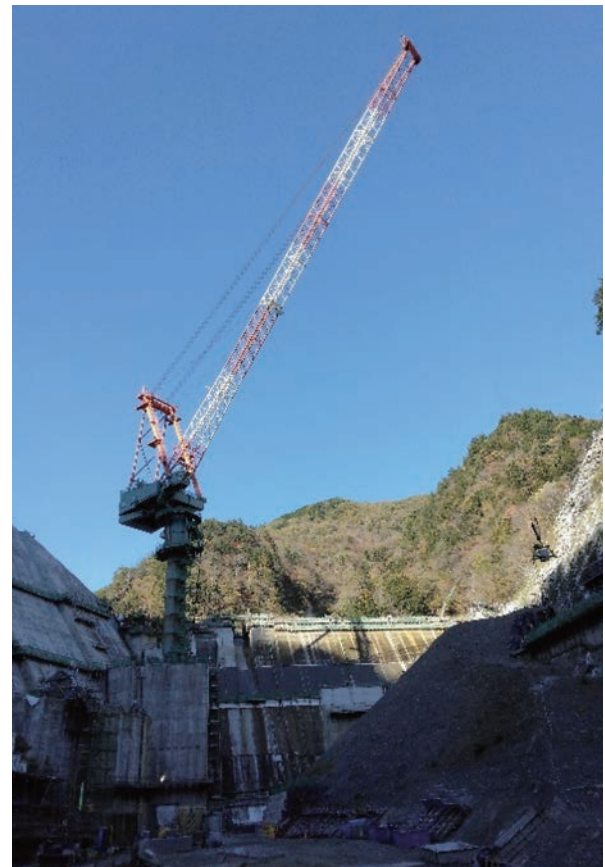
写真-3 内ヶ谷ダム 下流側からの眺め