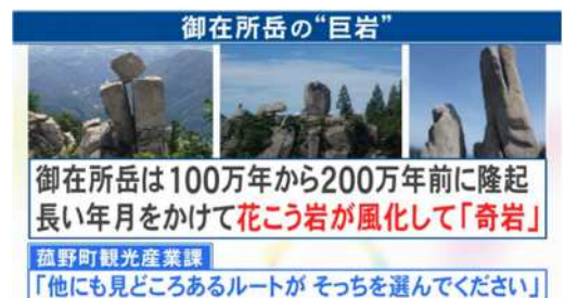
図-1 「御在所の巨岩」 風化によって作りだされた奇岩の数々。