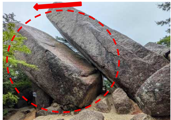
写真-2 「おばれ岩（倒壊後）」 元来支えあっていた岩同士が左側へ倒れるような形で大きく横に傾いている。

「おばれ岩」のはっきりとした倒壊原因は判明していませんが、菰野町関係者によると数日におよび降り注いだ大雨によって地盤が緩んだことが原因ではないかとのことです。