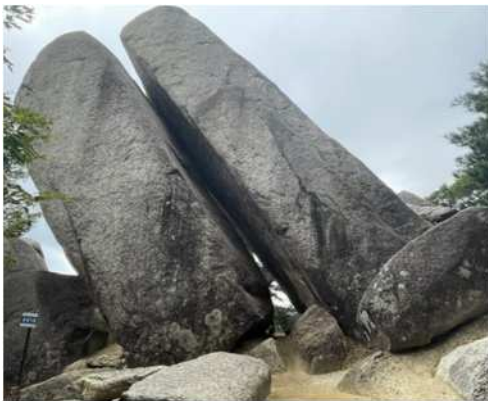
写真-1 「おばれ岩（倒壊前）」 大きい四角い岩が2つおぶさるように支えあっている正常な状態。