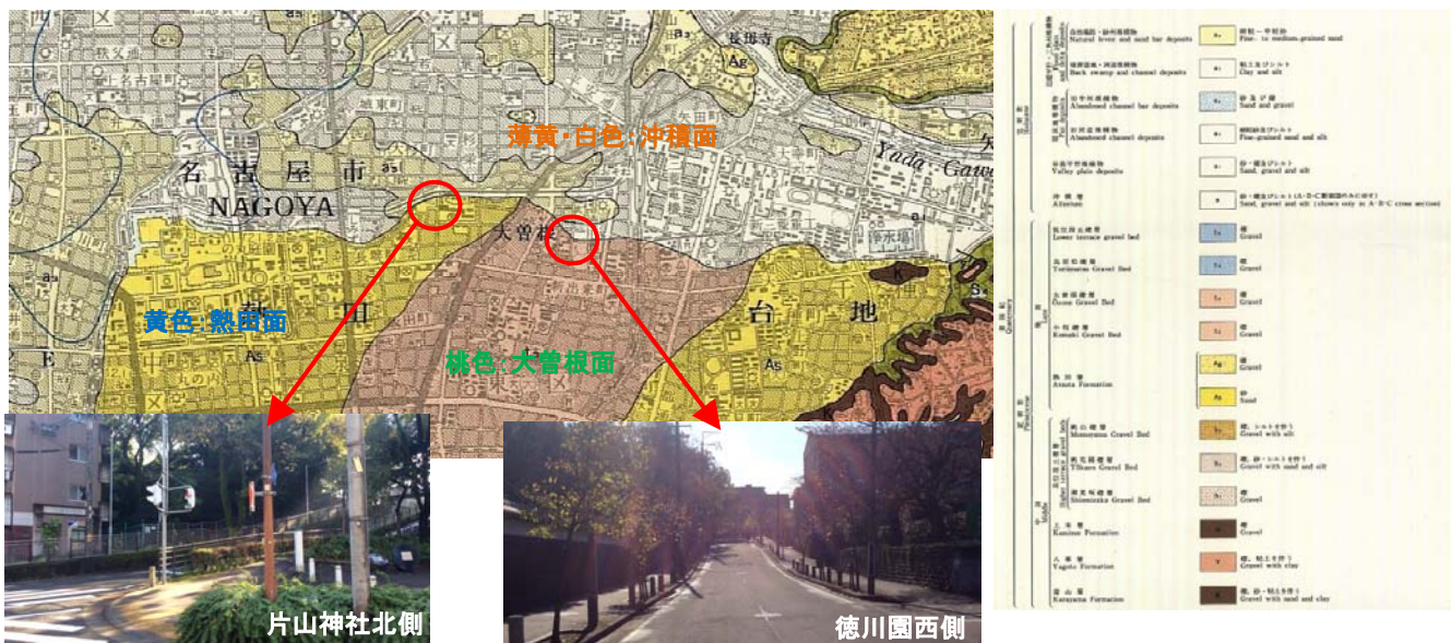
図-1 熱田面、大曾根面北端部付近の地質図

図-1の地質図に示す○印で段丘崖の写真を撮りました。写真ではわかりづらいけど、その場に立ってみると地形の変化が体感できます。