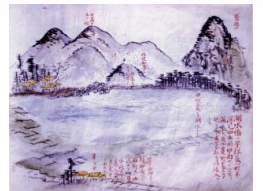
（上）小林村変地之図 （下）田地変ジテ湖水トナル 嘉永七甲寅歳地震之記より