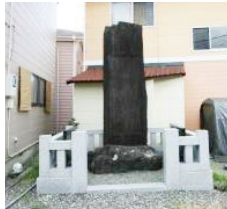
震災追弔之碑 （出典は右記）

絵図の一枚が「小林村変地之図」と題されるものです。この絵図には、沼津城下の小林村の大規模な陥没災害が描かれており、添えられた文章によれば、沼津城から一里北東にある小林村で12軒の家が土地の陥没により地面に飲み込まれ、9人が犠牲となり、うち2人は発見できなかったこと、陥没の範囲は、幅50間（約90m）、長さ2町（約220m）、深さ4～5丈（約12m～15m）に及んだことがわかります。小林村があった場所には、50年後の明治36（1903）年、地震による犠牲者の慰霊と災害を後世に伝えるために震災追弔之碑が建てられています。