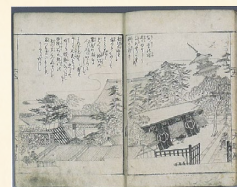
愛知県史別編 自然より

また、被害の様子を描いた挿絵も豊富で、「高い塀、練り塀ともに破損したが、特に練り塀が多く崩れた。かばやき町堀切筋横三蔵や、若宮八幡宮北の練り塀も多く崩れ、残骸が山のようになった」様子や、「はじめは南北に揺れていたが後には回転するように揺れ、近くの店の者は非常に驚いた」七ツ寺の塔の様子(下図)など、被害を視覚的に伝えるビジュアル災害誌ともいえるものとなっています。この世直双紙は当時著名な貸本屋・大惣の商品であり、流行本を取り扱う貸本屋が災害の記録を出版していたことも興味深い点です。