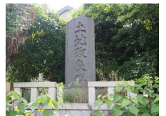
(上) 鋤神明宮の土地改良碑 (下) 室場区の土地改良碑