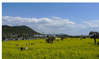
田原市観光協会 HP より

メイン会場の伊良湖菜の花ガーデンのほか、豊橋鉄道渥美線からは線路沿いに連なって咲く菜の花を見ることができ、トヨタ自動車田原工場付近では、延長800m、1万平方メートルに渡って菜の花のベルトが整備されるなど、各地で工夫を凝らした菜の花畑を見ることができます。