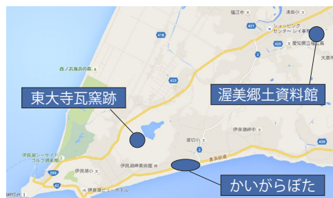
『伊良湖東大寺瓦窯跡』